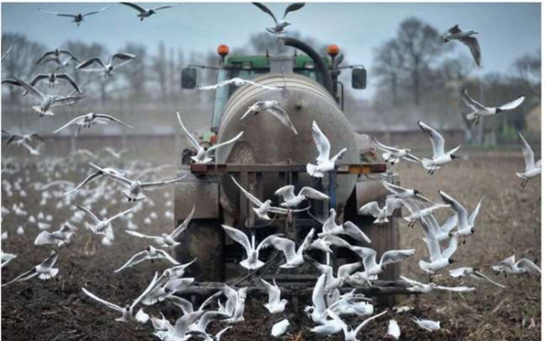
Het rapport over de mestfraude lag bijna twee jaar in de la van het ministerie.

Openbaar De eindoktober aangetreden minister Carola Schouten (Landbouw,